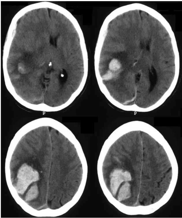
Figura 1. Mujer de 74 años, hipertensa, hipercolesterolémica e hipotiroidea. Fue llevada a la urgencia tras desarrollar hemiparesia izquierda, vómitos y progresiva disminución del nivel de consciencia. A su llegada a la urgencia presentaba apertura ocular y respuesta de localización con las extremidades derechas tras los estímulos dolorosos. Además se observó hemiplejía izquierda y midriasis derecha. La TAC mostró un hematoma de 6,5 cm de diámetro y 78 cc de volumen. Fue intervenida mediante craneotomía y evacuación del hematoma y trasladada tras estabilización al servicio de rehabilitación. A los 60 días del ictus presentaba adecuado nivel de consciencia, hemiparesia izquierda 4/5 y caminaba con ayuda. El estudio anatomopatológico del tejido resecado diagnosticó angiopatía amiloide.

significativamente en la ausencia de mejoría tras el tratamiento 5,9,14,16,27,31 . La evidencia derivada de trabajos experimentales y de estudios clínicos observacionales indica que los pacientes que parten de una situación clínica más grave tienen menor probabilidad de mejorar con el tratamiento quirúrgico 4,14,17,30,36,41,42 . El umbral crítico de afectación neurológica establecido por diferentes autores, por debajo del cual no estaría indicada la evacuación quirúrgica, varía, pero en general se establece en torno a una puntuación total de 4-5 en la GCS, estableciendo la mayoría de autores un GCS < 5 (respuesta motora < 3) como criterio de exclusión para un tratamiento agresivo 2,5,14,24,43 . Parece claramente no indicada la cirugía en pacientes con